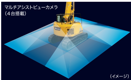
マルチアシストビューカメラ (4台搭載)