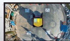
マルチアシストビュー™